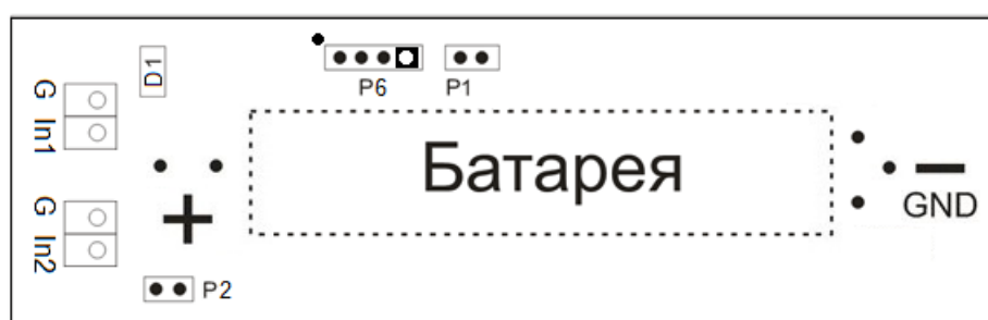
Рисунок 2 – Расположение контактов Модуля

Сечение подключаемого к разъему Модуля провода: 0,2...0,5 кв. мм.