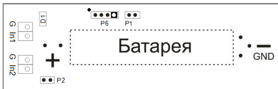
Рисунок 2 – Расположение контактов Модуля

Сечение подключаемого к разъему Модуля провода: 0,2...0,5 кв. мм.